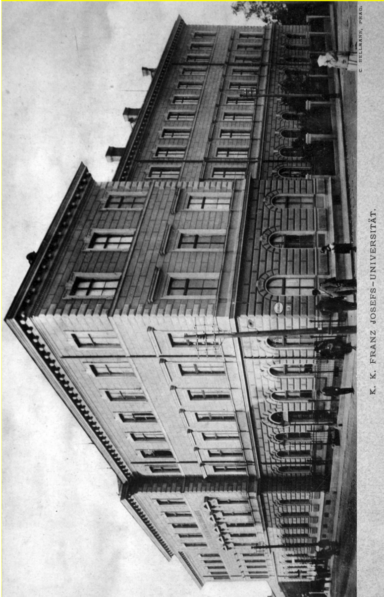
Picture 6. Franz Joseph University in Czernowitz, undated.

Source: Die k. k. Franz-Josephs-Universität in Czernowitz im ersten Vierteljahrhundert ihres Bestandes : Festschrift / hrsg. vom akademischen Senate. Czernowitz : Bukowinaer Vereinsdruck, 1900