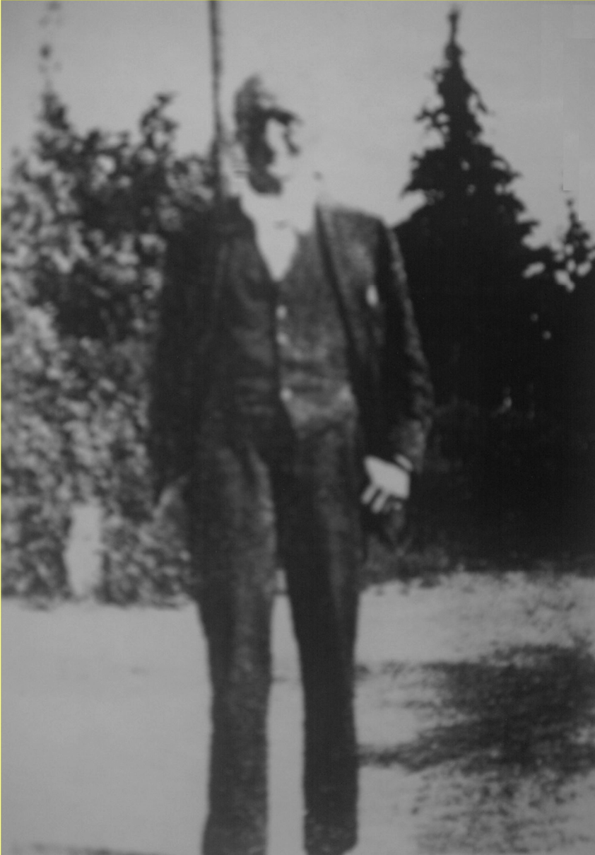
Picture 5. Eugen Ehrlich, undated.